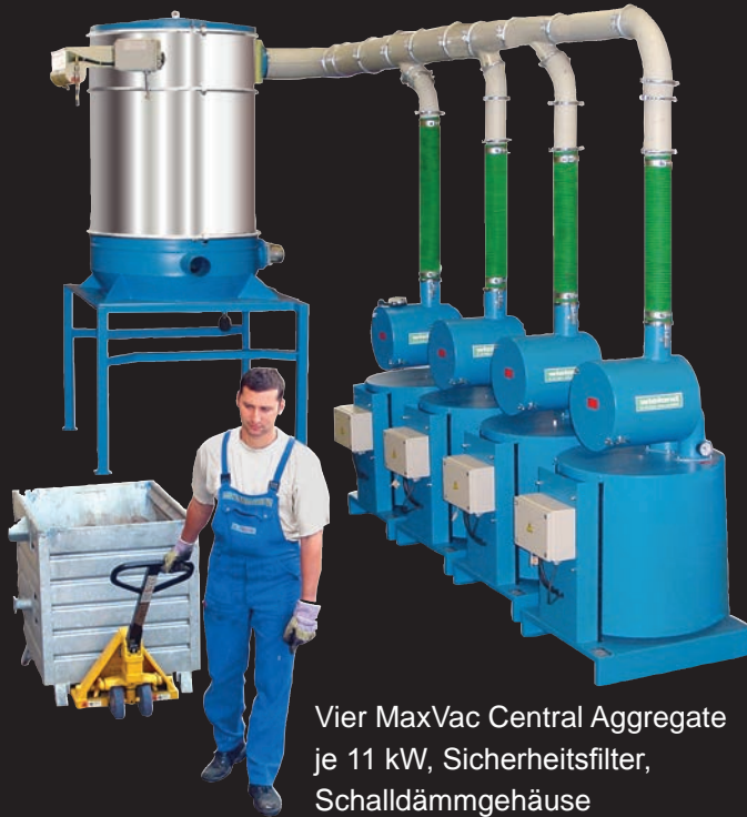
Vier MaxVac Central Aggregate je 11 kW, Sicherheitsfilter, Schalldämmgehäuse