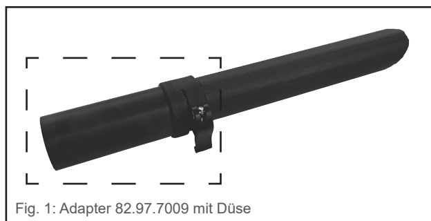
Fig. 1: Adapter 82.97.7009 mit Düse