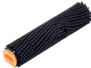
Weiche Bürste, schwarz