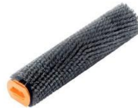
Harte Bürste, grau