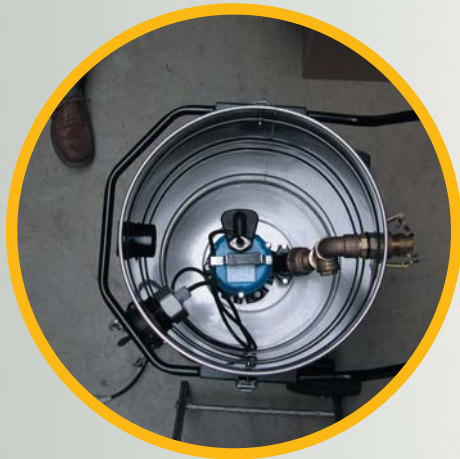
Situation für Nass-Einsatz ...

Von „Nass“ auf „Trocken“ in 120 Sekunden!