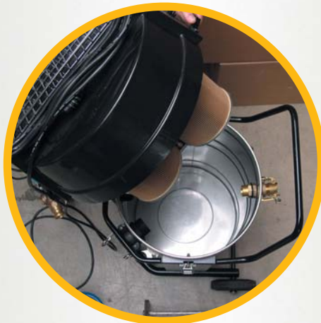
Blindstopfen anbringen ...