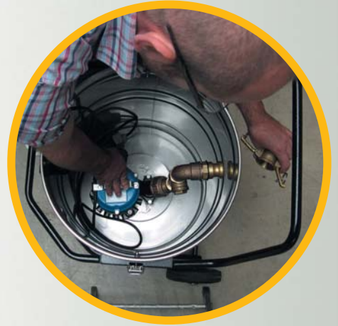
Pumpe lösen ...