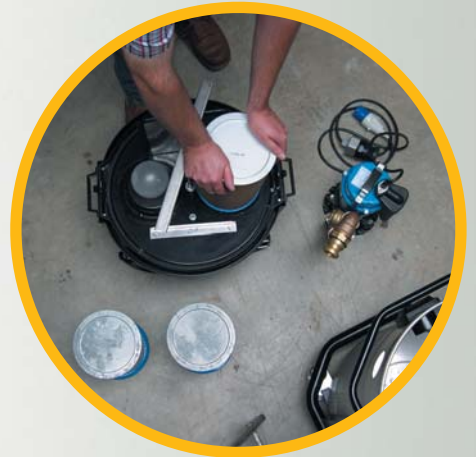
Trockenfilter aufsetzen ...