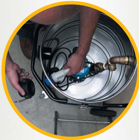
Stecker lösen ...