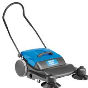
Die Abbildung repräsentieren nicht das Modell

Die Handkehrmaschine FLOORTEC 480 M ist die ideale Lösung für kleine Flächen im Innen- und Außenbereich. Sie nimmt Schmutz wie Staub, Sand, Kies, Dosen, Kronkorken, Zigarettenkippen, etc. durch das Überwurfkehrprinzip mühelos auf.