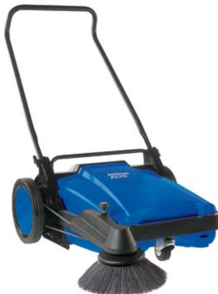
Die Abbildung repräsentieren nicht das Modell

Großer, robuster Schmutzbehälter mit Tragegriff. Ideal zum Kehren von Blättern, trockenem Schmutz in kleinen Mengen, Kronenkorken und Zigaretten usw.