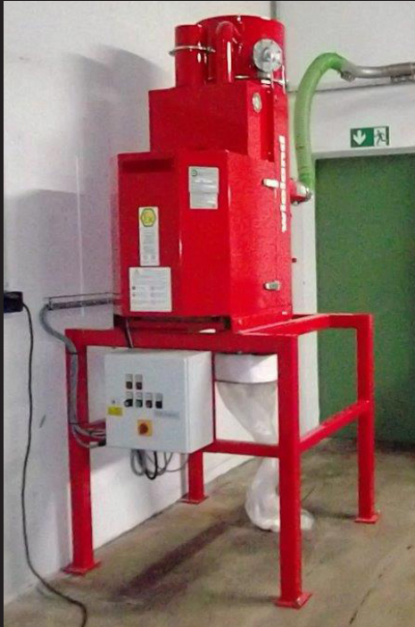
TowerVac 76 MultiPac in einer Milchpulveranlage

Die MultiPac-Geräte sind in verschiedenen Ausführungen lieferbar - fahrbar oder stationär.