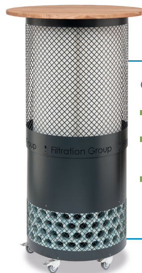
SilentCare Variante als Stehtisch