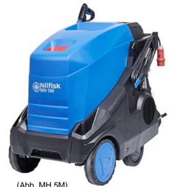
(Abb. MH 5M)

3 Jahre Gewährleistung auf Nilfisk Industrierpumpen